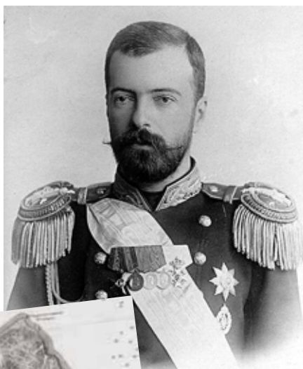
Великий князь Александр Михайлович

генерал-губернатор Восточной Сибири М.С. Корсаков направил на Аскольд чиновника по особым поручениям Главного управления Восточной Сибири, коллежского асессора П.А. Лопатина «для обследования острова». Пробыв там с 4 по 30 октября, Лопатин с четырнадцатью солдатами и унтер-офицером пробурили семь шурфов. В шести из них присутствовало золото. Докладывая в служебной записке, что «в самом богатом шурфе от промывки 10 пудов золотоносного песка получено 15 гран золота» [5] он рекомендовал продолжить изучение золотоносных россыпей острова.